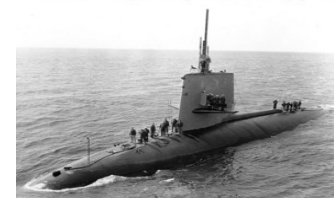
Photo # NH 70303 USS Scorpion comes alongside USS Tallahatchie County, April 1968

Coordinamento "Fermiamo chi scherza col fuoco atomico" Versamento su conto corrente postale n. 13382205 , intestato a L.O.C. Lega Obiettori di Coscienza Via M. Pichi, 1 20143 Milano specificare nella causale "Disarmo Atomico". Sostieni le iniziative per la denuclearizzazione